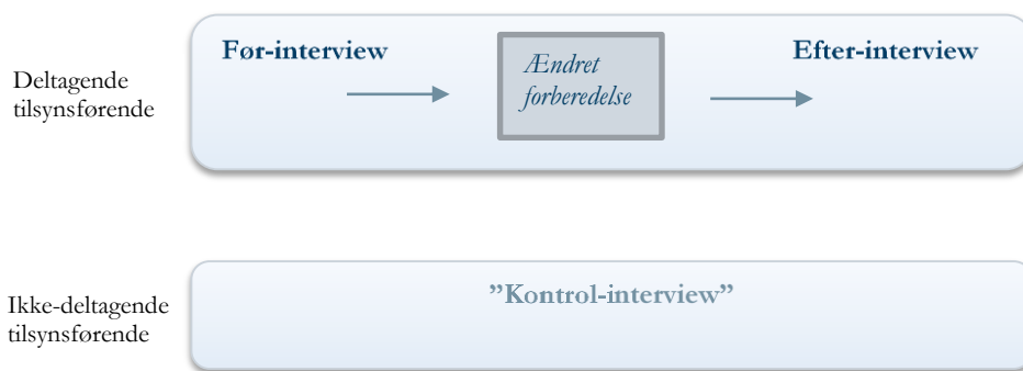
Figur 1.2: Illustration af evalueringsdesign

Vores metodedesign har været kvalitativt funderet, og vi har i interviewene spurgt kvalificeret og uddybende ind til de tilsynsførendes praksisser, tilgange og overvejelser. Dataindsamlingen har vi anskuet som en iterativ proces, hvor informanten ikke blot har redegjort for de nye erfaringer i forbindelse med tilsynet, men i samspil med konsulenten har reflekteret over sine erfaringer med den nye procedure. For at kunne bygge videre på de tilsynsførendes erfaringer har vi derfor også prioriteret, at den samme konsulent blev tilknyttet en tilsynsførende undervejs i dataindsamlingen for at sikre kontinuerlig fælles refleksion mellem interviewer og informant.